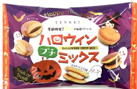
「163g ハロウィンプチミックス」

※発売日:2016年8月29日 受注締め日:9月2日 受注締めについてご不明な点が御座いましたら各担当セールスまでご連絡ください。受注締め日を設定しておりますが、資材がなくなり次第終売となりますのでお早めのご注文をお願い申し上げます。