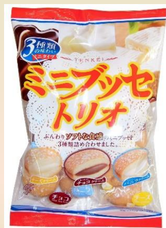
「140g ミニブッセトリオ」 好評発売中(通年商品)